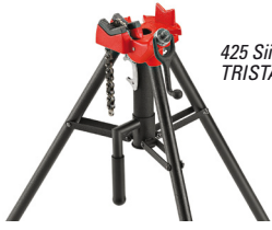
425 Siirrettävä TRISTAND-ketjupuristin