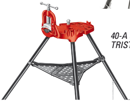
40-A Siirrettävä TRISTAND-putkiruuvipuristin