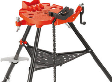
460-12 Siirrettävä TRISTAND-ketjupuristin