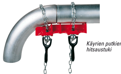
Käyrien putkien hitsaustuki