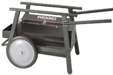
Malli 200A teräskotelolla