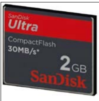
SD muistikortti 200 ohjelmaa