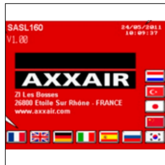
5,7” kosketusnäyttö monikielinen