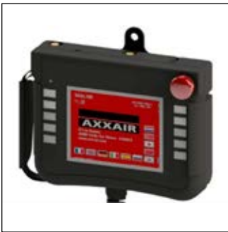
5,7” väri-kosketusnäyttö-kauko-ohjain monikielisenä